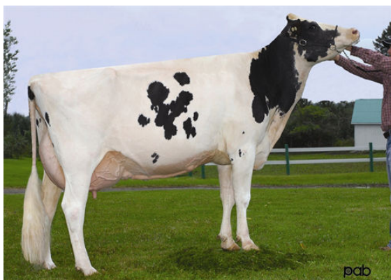
MARYCLERC B CHAMPION SILVIA FIFTH DAM