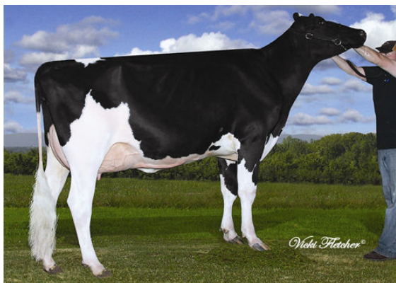
BELFAST M GOLDWYN SHELLY FOURTH DAM