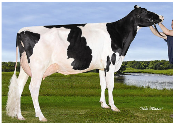
ARCADIA D LOU SOFIA THIRD DAM